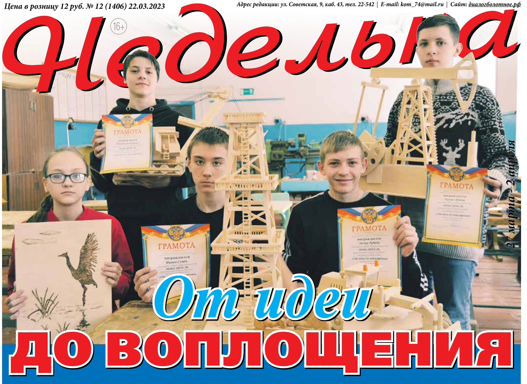
27 марта - 2 апреля